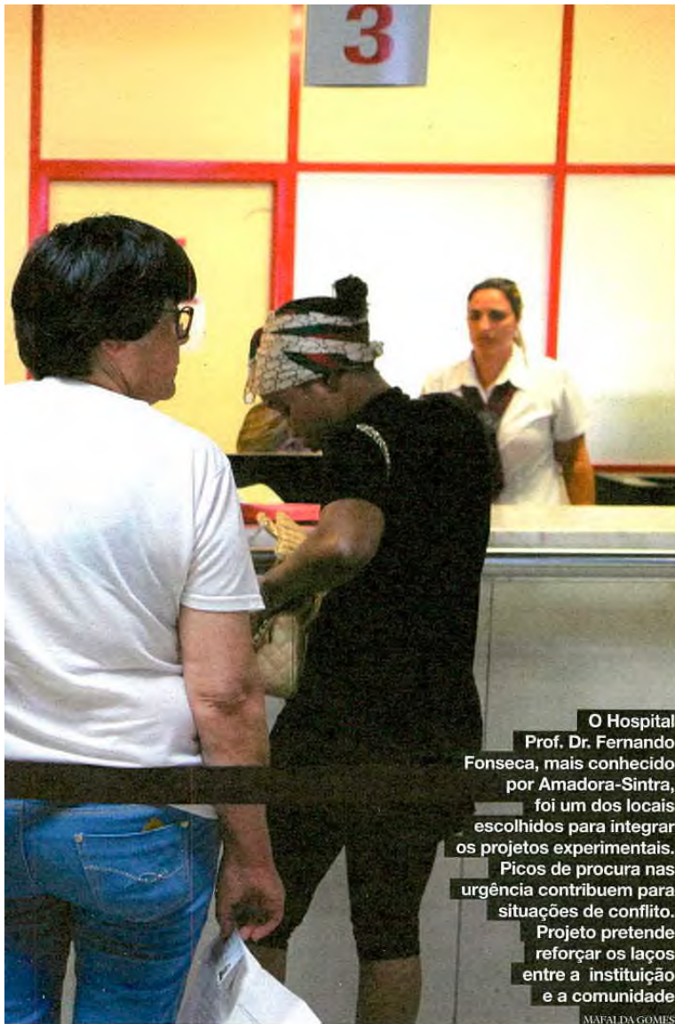
O Hospital Prof. Dr. Fernando Fonseca, mais conhecido por Amadora-Sintra, foi um dos locais escolhidos para integrar os projetos experimentais. Picos de procura nas urgência contribuem para situações de conflito. Projeto pretende reforçar os laços entre a instituição e a comunidade